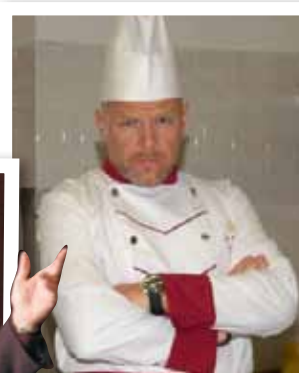
▲ Ač se označil za nevaříče, v rondonu se objevil v komedii Vení, vidí, vici (2009).